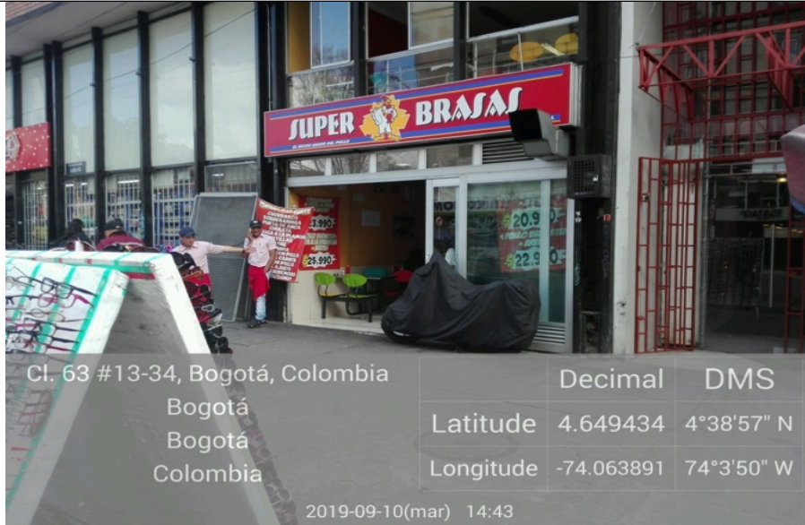
SEGUIMIENTO. Aviso en fachada y pendón